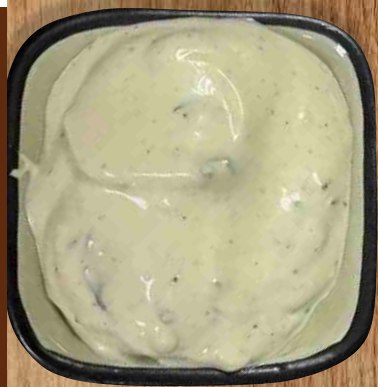
ОТ ПЕТРОВИЧА чесночный